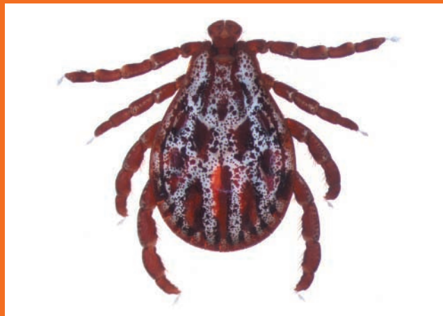
Erwachsene Auwaldzecken sind nüchtern 5 – 6 mm groß. Vollgesogen mit Blut werden sie bis zu 1,6 cm groß und damit deutlich größer als der Holzbock. Ein weißer Schild mit dunklen Flecken bedeckt bei der männlichen Auwaldzecke den ganzen Rücken (im Bild), bei Weibchen, Nymphe und Larve nur den vorderen Teil des Rückens.

In Deutschland schon lange weit verbreitet ist der „Holzbock“ ( Ixodes ricinus ). Je nach Region kann er beim Stich die Lyme-Borreliose übertragen, die zu schweren Gelenkproblemen und Nierenschäden führt. Für die Erreger der Gehirnhautentzündung (FSME), die von dieser Zeckenart ebenfalls übertragen werden können, sind Hunde kaum empfänglich. Deshalb hat diese Erkrankung in der Tiermedizin eine eher untergeordnete Bedeutung. Besonders gefährlich für den Hund ist dagegen eine, in immer mehr Regionen Deutschlands anzutreffende neue Zeckenart, die Auwaldzecke ( Dermacentor reticularis ). Sie ist Überträger der Babesiose , einer in Deutschland recht neuen Erkrankung, die auch als „Hundemalaria“ bezeichnet wird.