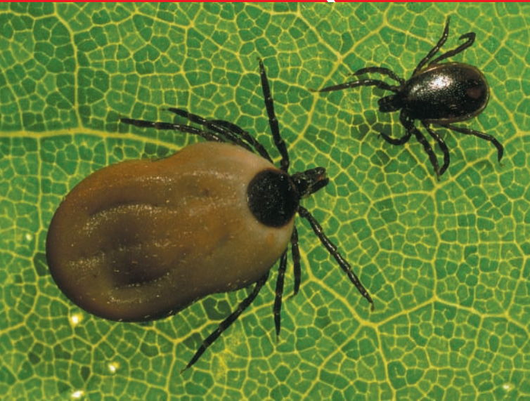
Der „Holzbock“ (links: erwachsene Zecke, rechts: Nymphe) ist rotbraun bis blaugrau. Erwachsene Männchen sind durchschnittlich nur 2,5 mm, Weibchen 3,5 mm groß. Mit Blut vollgesogen erreichen sie eine Größe bis zu 1 cm.